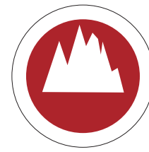
Beispiel Motiv 2-farbig