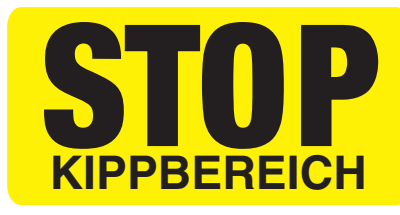
Beispiel Motiv 3-farbig