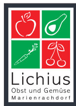
Beispiel Motiv 3-farbig