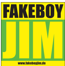
Beispiel Motiv 3-farbig